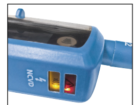
Double diode de sécurité et continuité