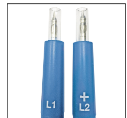
Pointes de touche IP2X