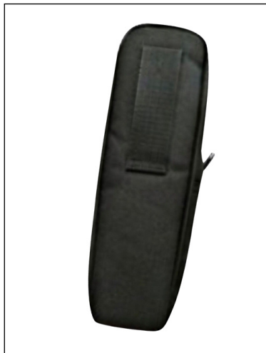
SC518: Sacoche de protection