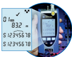
Schéma de câblage et longueur par paire