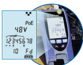
Détection de service