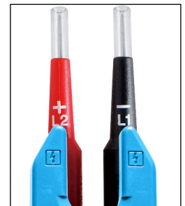
Pointes de touche IP2X (2mm et 4mm)