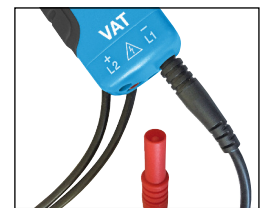
cordons pointes de touche détachables