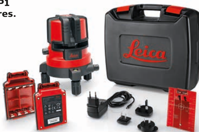
Leica Lino L4P1 - Ref 834 838