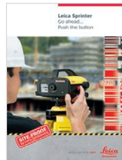
Leica Sprinter Travailler... Par une simple pression de bouton

Illustrations, descriptions et données techniques non contractuelles. Tous droits sont réservés. Imprimé en Suisse – Copyright Leica Geosystems AG, Heerbrugg, Suisse, 2014. 798543fr – 06.14 – galledia