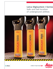
Leica Digisystem i-Series localisation sûre et rapide des réseaux enterrés