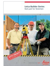
Leica Builder Pour tous les professionnels