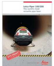
Leica Piper 100/200 Le laser de canalisation le plus polyvalent au monde