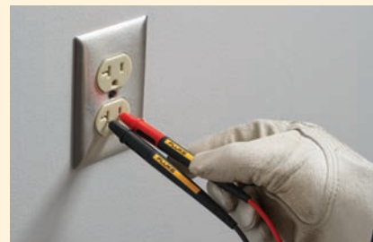
Pointe extensible les mesures de CAT II