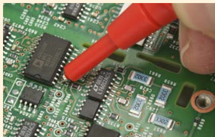
Exposition réduite de la pointe pour un positionnement précis