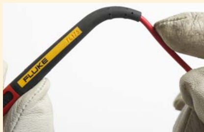
Points de dégagements résistant à plus de 30 000 courbures