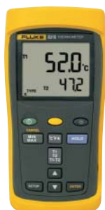
Fluke 52 II