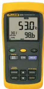
Fluke 53 II