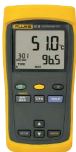
Fluke 51 II